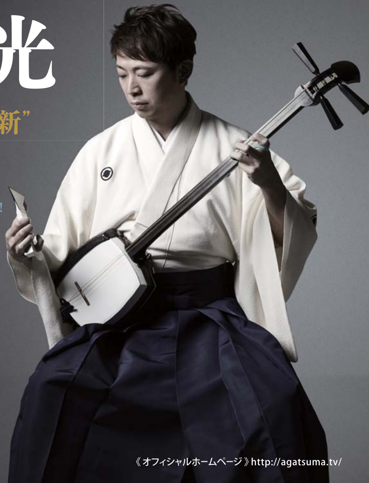
《オフィシャルホームページ》 http://agatsuma.tv/

また日本全国の小学校において日本の伝統音楽の魅力を伝える授業を行っており、次世代への文化伝承にも力を注いでいる新世代津軽三味線奏者の第一人者である。