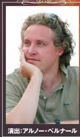
演出: アルノー・ベルナル