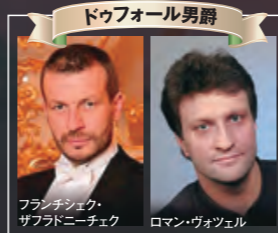
ドゥフォーール男爵