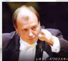
レオシュ・スワロフスキー