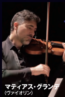
マティアス・グランデ (ヴァイオリン)