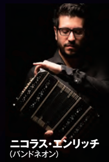
ニコラス・エンリッチ (バンドネオン)